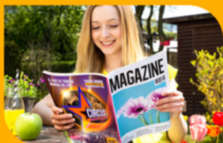
ANUNCIS en revistes i portals especialitzats

Comptem amb una gran BASE DE DADES que cobreix gran part del sector circense mundial. Aquest fet ens permet impactar directament a TOT EL CORE TARGET del Saló: empresaris, directors de càsting, artistes, aficionats... arribant directament a les seves cases a través de: