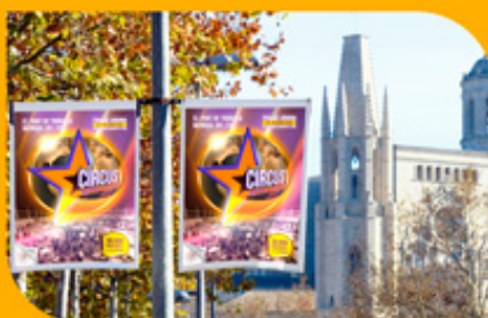
PUBLICITAT en xarxes socials i exteriors