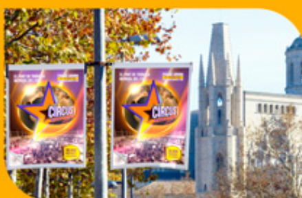
PUBLICITÉS dans les réseaux sociaux et extérieurs